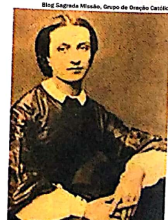
LÉONIE . Beatificada em 1992 pelo papa João Paulo II