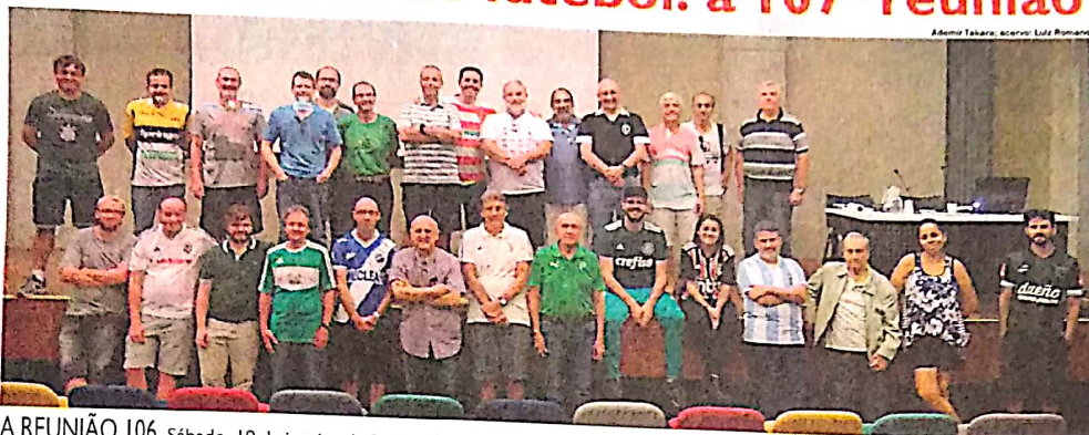
A REUNIÃO 106. Sábado, 19 de janeiro de 2019, a foto coletiva dos participantes da reunião anterior: do grupo fazem parte vários esportistas do Grande ABC

"Por motivo das últimas abundantes chuvas, o campo do Floresta acha-se alagado de modo a não permitir a realização do jogo entre o Minas Gerais FC e o Palestra Itália, para hoje anunciado."