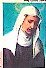
Blog Editora Cleofas

VERIDIANA. O culto a ela é muito popular na Toscana