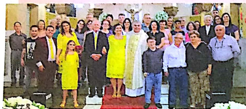
BODAS DE OURO – 2. No sábado, 24 de novembro, na Sagrada Família em São Caetano, a família reunida no mesmo altar-mor de 1968: missa de ação de graças e o rito da renovação das promessas matrimoniais celebrados pelo padre Paulo Borges