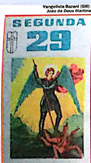
MIGUEL ARCANJO. No calendário ilustrado de 1958, uma segunda-feira

Hoje é a festa dos três arcanjos: Gabriel, que significa 'Deus é forte' ou 'Aquele que está com Deus'; Miguel ou 'Quem como Deus'; Rafael, 'Medicina de Deus' ou 'Deus cura'.