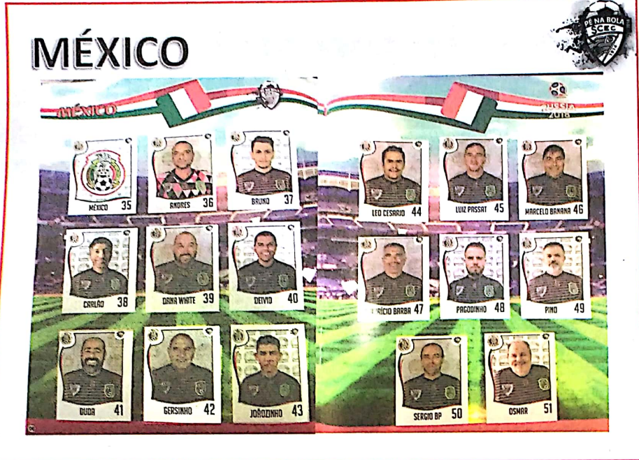
MEXICANOS SÃO-CAETANENSES. Um a um eles participaram da nova versão do Pé na Bola no São Caetano Esporte Clube: longe do profissionalismo há 60 anos, o clube ainda tem no futebol uma marca significativa