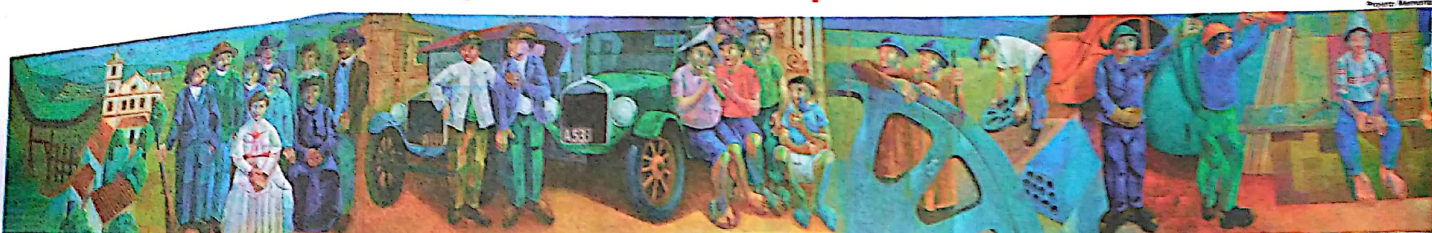
OBRA DE ARTE. A pintura de Sarro inaugurada em agosto de 1994 para simbolizar várias etapas da história de São Bernardo, da imigração à indústria: por que enviar este painel para fora da cidade?