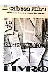
Capa: Nat Vieira

Próximo tema, Cabeça Ativa nº 43, Bruxas e Fadas . Até lá, Memória vai folhear muitas vezes mais o nº 42, repassando a vocês essas delícias literárias. Porque livro é tudo.