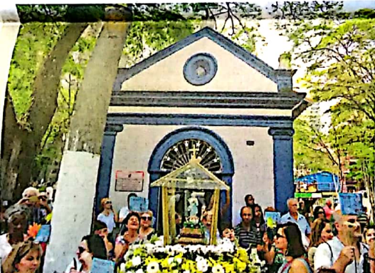
REENCONTRO. Imagem histórica defronte à capelinha da Boa Viagem: aqui foi a sua segunda casa depois da criação da Paróquia de São Bernardo, no início do século 19