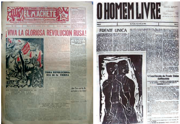
Capas dos jornais El Machete (México) e O Homem Livre (Brasil).

Abramo publicará várias de suas gravuras nesse periódico, em que retratou o cotidiano do operariado paulista e de crítica à Guerra Civil Espanhola, sempre em uma linha expressionista. Livio Abramo foi um dos mais marcantes artistas engajados do período. Militante comunista e ilustrador do jornal do PCB, foi expulso ao se recusar a fazer uma caricatura de Trotsky. Trabalhou no jornal Luta de Classes , da oposição de esquerda, no Petrachone , também socialista, e posteriormente no jornal O Homem Livre .