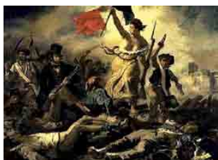
Figura 15 – La Liberté guidant le Peuple , de Eugène Delacroix, 1830