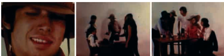
Sur (1970), de Gabriel Retes. Close up nos créditos iniciais. Diorama para cena de assalto ao banco e à taverna.

ções e estabelecer uma relação de profundidade de campo entre personagens e paisagem. Neste, que era seu primeiro filme, percebia-se uma preocupação com a perfeição e uma aspiração ao grande cinema. Por exemplo, na busca da boa qualidade de imagem, Retes costumava filmar 24 quadros por segundo, em vez de 18, velocidade comum usada pelos usuários do Super 8 que queriam economizar material. 45