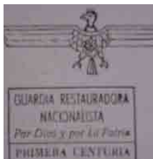
Figura 7 – Mazorca , 1966, n.2, contracapa (doação)