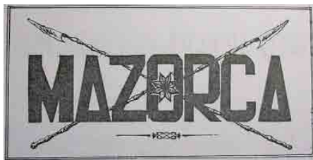
Figura 12 – Mazorca , 1966, capa (doação)