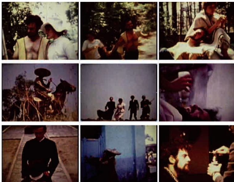
El fin (1970), de Sergio García.

O soldado corre por um corredor de pedra e dá uma coronhada em um jovem (outro distinto daquele perseguido pelo aldeão, a mãe, o cura e o homem de terno), que fica estendido com um jorro de sangue na cabeça. Funde-se com a praça das três culturas de Tlatelolco, mas vista como que através de um magiscópio de Feliciano Béjar. 33 Mesclam-se imagens variadas sobre uma parte acelerada da música do The Doors, para dar uma sensação de vertigem: um anúncio de Coca-Cola no mundial, o Monumento a la Raza, diversas cenas da cidade, propaganda política de Luis Eche-