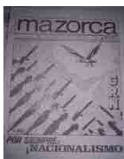
Figura 9 – Mazorca , 1968, n.13, capa (doação)