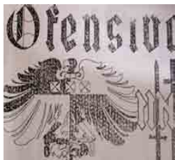
Figura 1 – Ofensiva MNT, 1962, capa (Arquivo Cedinci)