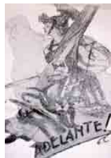
Figura 14 – Detalhe de Tacuara MNT