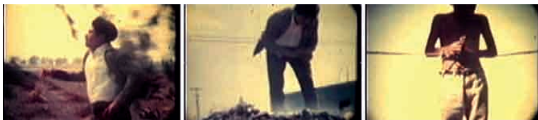
Mi casa de altos techos (1970), de David Celestinos.

O personagem chega a uma zona marginal. Em um depósito de lixo, ao lado de um cão morto, pega uma ratoeira, que examina minuciosamente. Em seguida aparece uma imagem simbólica: um menino, situado à contraluz com uma auréola que dá à composição um tom de sacralidade, amarra uma corda grossa.