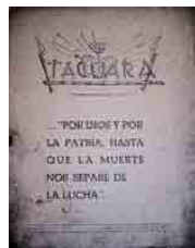
Figura 3 – Tacuara UNES, 1945, capa