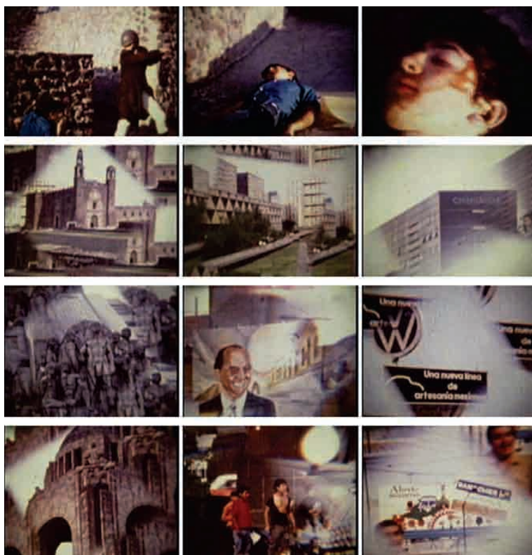
El fin (1970), de Sergio García.

verría (então candidato à presidência da República), um anúncio de cerveja, outro de automóveis, o Monumento à Revolução, com uns meninos da rua de baixo, um cartaz que proíbe a volta da esquerda, a bandeira de listras e estrelas da embaixada norte-americana, o Monumento à Independência, o anúncio de Bancomer. Finalmente, termina a vertigem da montagem e o jovem, agora de terno e bigode (reconhecemos o personagem inicial na prisão com forma de mapa) conduz seu automóvel, escuta uma canção de Armando Manzanero (“Adoro”) e percorre a cidade, passando pela praça do Metrô Insurgentes.