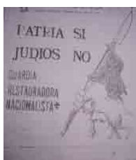
Figura 18 – Mazorca GRN, 1969 (?), n.16, contracapa (doação)