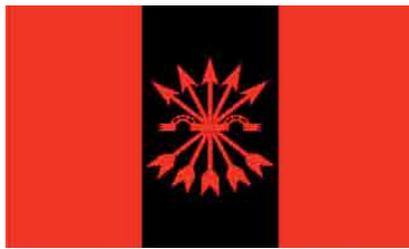
Figura 10 – Emblema da Falange espanhola