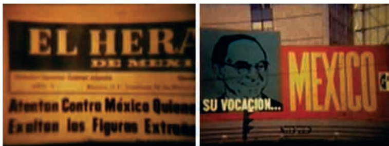
Jícama (1970), de Sergio Díaz Zubieta e O. Santos.

Santos era expor o absurdo da retórica oficial do regime, presente em cabeçalhos do jornal que naquela época apresentavam nos títulos frases extraídas dos discursos do presidente da república ou de algum outro político de destaque, e confundiam doentivamente uma notícia com a retórica.