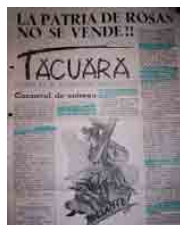
Figura 5 – Tacuara MNT, 1962(?), n.8, capa