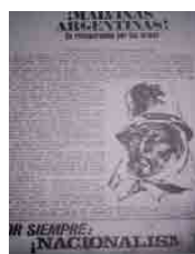
Figura 20 – Mazorca GRN, 1968, n.14, contracapa (doação)