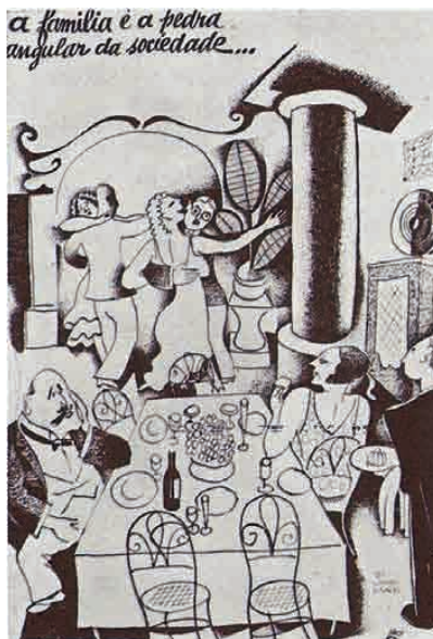
Detalhe do mural Visão política do povo mexicano , de Diego Rivera, na Secretaria de Educação Pública (México), 1923-1928. Página do álbum A realidade brasileira , de Emilio Di Cavalcanti (Brasil), 1930.