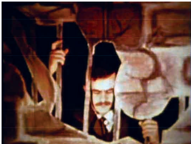
El fin (1970), de Sergio García.

O que acontece é que... veja, é difícil de entender agora, mas realmente até 68 a sociedade mexicana era opressiva, muito opressiva sobre os jovens. E muito repressiva também. Opressiva e repressiva. Éramos presos de... de que seria? Presos de expressão; os jovens não podiam se expressar, não podiam usar cabelo comprido nem nada... Eu pertencia a uma juventude totalmente reprimida. Não apenas na escola, mas na minha casa e na sociedade... era obrigado a ir à missa todos os domingos, a respeitar o pai; “não coloque os cotovelos na mesa”, “mastigue com a boca fechada”, “diga com licença e por favor...”. E, naturalmente, sexo, não, não, não! O sexo era proibidíssimo, não era? – A prisão era a sociedade ou a nação? – Ambas: a sociedade da nação e a nação enquanto sociedade. 30