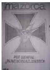
Figura 8 – Mazorca , 1969, n.12, capa (doação)