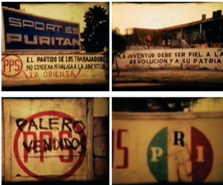
Jícama (1970), de Sergio Díaz Zubieta e O. Santos.

Entretanto, a força do filme encontrava-se na edição. A fita inicia-se com uma tomada do Monumento a la Revolución, indicando ao espectador que ele vai presenciar uma crítica ao regime. Imediatamente depois apresenta-se um plano rápido sobre uma propaganda da campanha de Luis Echeverría, que anuncia: “A falsidade é própria da ditadura”. A câmara concentra-se no logotipo do PRI e faz um corte na palavra “ditadura” que combina de maneira alternada com uns postes de eletricidade para finalizar em uma imagem do Mickey Mouse colocando o dedo na frente da palavra “ideia”, associando o PRI com a ditadura, como pode ser observado no seguinte fotograma que indica o corte de uma imagem com a seguinte: