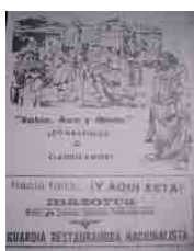
Figura 19 – Mazorca GRN, 1969, n.12, contracapa (doação)