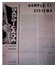
Figura 6 – Barricada MNRT, 1963, n.4, capa