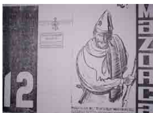
Figura 16 – Mazorca GRN, 1966, n.12, capa (doação)