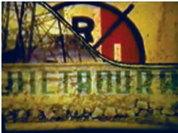
Jícama (1970), de Sergio Díaz Zubieta e O. Santos.

A montagem mostrava uma grande agilidade. À guisa de exemplo, descrevo a seguir uma das sequências. Aparece um cartaz estilo pop de Luis Echeverría que diz: “México: sua vocação”. Plano rápido nas letras, provavelmente extraídas de um comercial publicitário: “tem ânsia de poder ou de serviço”. “Você já o conhece. Vote no PRI.” Foto de lontras nadando. Montagem entre o nome “Luis Echeverría” e marquesina (toldo) com o título “Quando você precisar de mim”. Foto de uma mulher seminua. “Abre-te sésamo”, em um cartaz publicitário. “A grande mudança.” Caricatura em que aparece um grupo de pessoas assustadas. “Vamos para uma nova etapa da história.” “A dignidade, a independência, a justiça, a paz.” Foto de uma negra obesa rindo. “Liberdade para os presos políticos” (esta é uma das poucas mensagens políticas não oficiais). “Juventude: seja inflexivelmente revolucionária.” Ou, em outras ocasiões, a edição para uma paródia entre a escolha de partidos políticos ou da marca de um refresco, precedida da frase “Por uma democracia econômica” (sic).