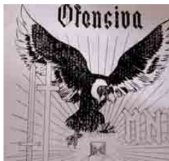
Figura 2 – Ofensiva MNT, 1962, capa