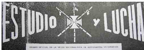
Figura 11 – Logotipo de Estudio y Lucha