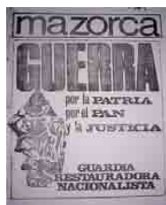
Figura 17 – Mazorca GRN, 1969 (?), n.16, capa (doação)