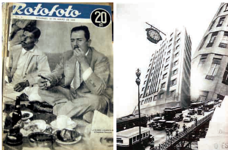
Capa da revista Rotofoto (México), 1938, e fotomontagem de Priesing e Vamp na revista S. Paulo (Brasil), 1936.

No México merece destaque a pintura mural. Já existe uma ampla bibliografia sobre o tema. Vou aqui me deter mais a trabalhos mais recentes que vêm procurando estabelecer um novo diálogo com essa produção.