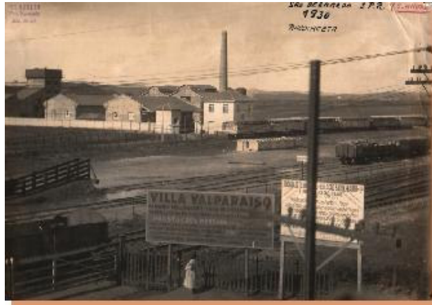
Fábrica Rhodiaceta ao fundo e Estrada de ferro de São Paulo Railway á frente,1930.A fábrica ainda ocupa essa área.

O distrito de Santo André abrigava na década de 1930 várias indústrias importantes, possuía a Estação de São Bernardo por onde era transportada grande parte dos produtos aqui produzidos e tinha entre seus moradores vários políticos influentes. Tal situação levou à transferência da sede do município de São Bernardo para Santo André, em 1939. Toda a região do Grande ABC, composta por vários distritos, passou, então, a ser denominada pelo nome Santo André.