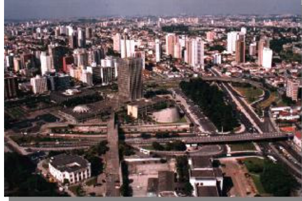
Vista de centro de Santo André, 1998.

Tratado de Tordesilhas - foi celebrado em 1494 em Tordesilhas, município da província de Valladolid, na Espanha. Era um acordo entre os Reis Católicos da Espanha Fernando e Isabel e o rei de Portugal, D. João II, que repartia entre os dois reinos a posse das terras descobertas e a descobrir. Delimitava as esferas de ação de Portugal e Espanha nos descobrimentos marítimos, traçando uma linha imaginária a 370 léguas das Ilhas de Cabo Verde, no Oceano Atlântico. As terras a leste pertenceriam a Portugal e à oeste seriam da Espanha. Esse tratado vigorou até 1750 quando foi revogado.