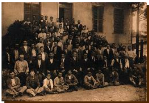
Grupo de operários da Companhia Streiff, Rua Cel. Oliveira Lima, c. déc. 1920.

A expansão industrial remonta ao final do século 19 e caracterizou-se por muito tempo por um misto de produção industrial e artesanal. As primeiras indústrias foram a Tecelagem Silva Seabra & Cia, conhecida também como Fábrica Ypiranguinha por estar sediada na região conhecida por esse nome. Foi inaugurada em 1885 e produzia brim de algodão. Esta indústria operou até a década de 1970. Outra tecelagem instalada ainda no século 19 foi a Bergman, Kowarick & Cia que iniciou suas atividades em 1889 e fabricava casemiras. A primeira fábrica de móveis foi a Companhia Streiff de São Bernardo, inaugurada em 1897 e produzia, principalmente, cadeiras.