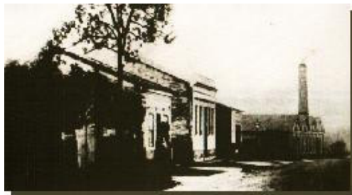
Rua Cel. Oliveira Lima, vendo-se ao fundo a Companhia Streiff, 1899.

química, têxtil e de móveis. Além disso, foram surgindo pequenos negócios como carpintarias, funilarias, sapatarias, barbearias, pequenas pensões e restaurantes, que foram dando uma feição mais urbana à região. Nesse contexto ressurgiu o termo Santo André, nomeando o distrito criado em 1910 e que compreendia áreas próximas à Estação.