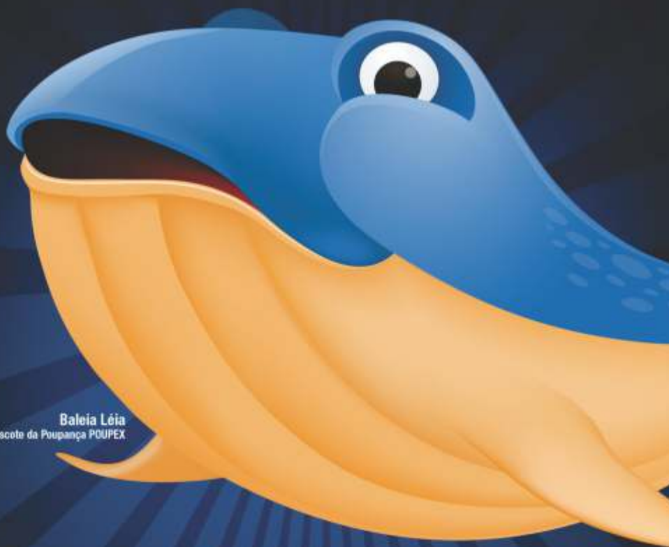
Baleia Lóia mascote da Poupança POUPEX

Realize seus sonhos, faça já a sua Poupança POUPEX!