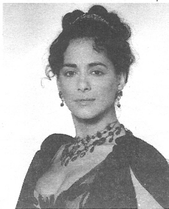
São José, quem diria, é linda

( Jornal do Brasil , Caderno B, 01 de novembro de 2006)