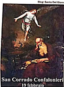
Blog: Santo Del Giorno