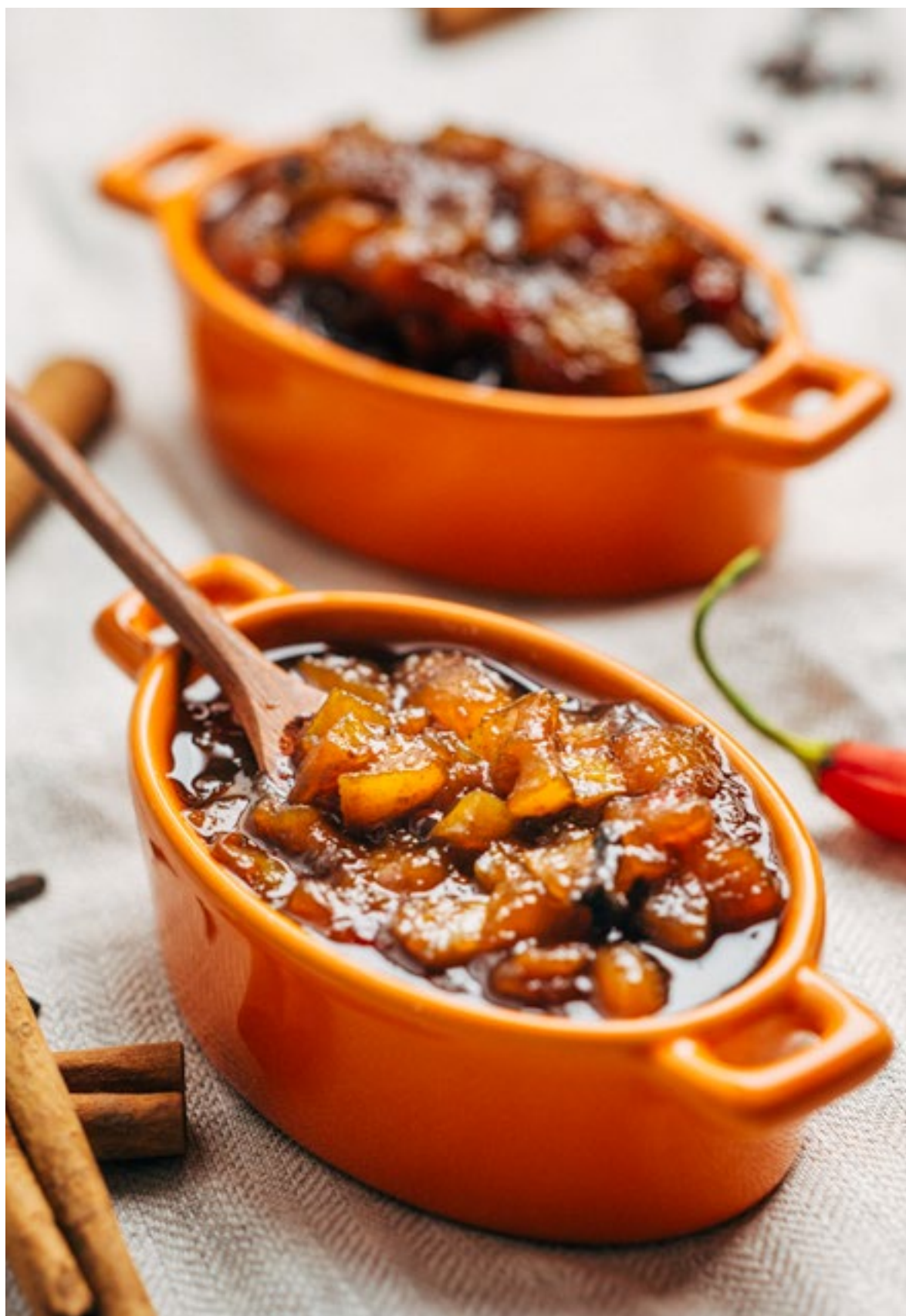
Doce de pera com Pimenta Dedo-de-Moça. Receita de Luciana Diniz