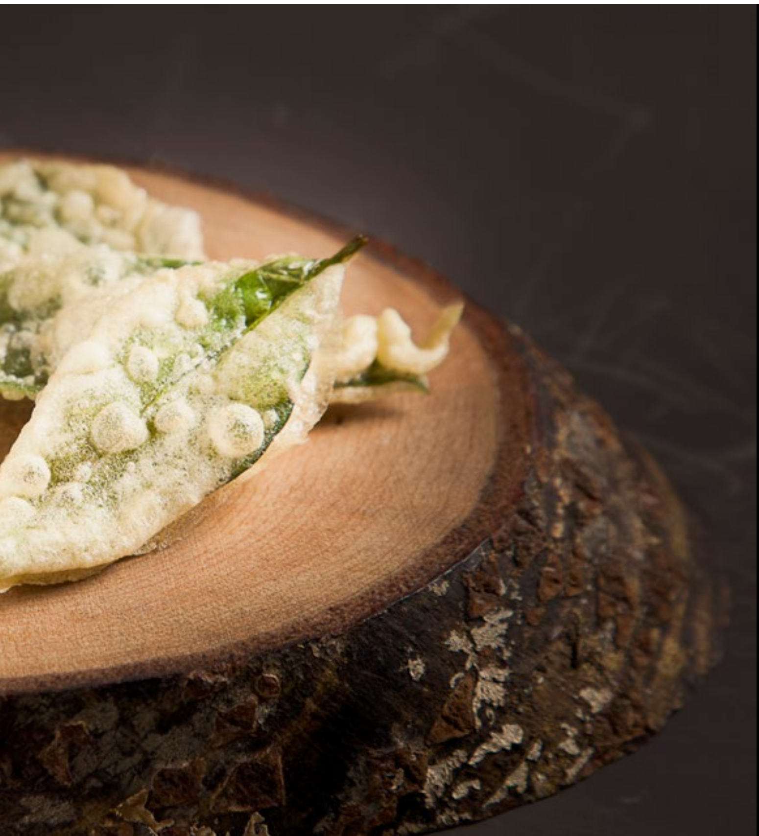
Tempurá de ora-pro-nóbis com ponzu de bacupari. Receita de Bel Coelho