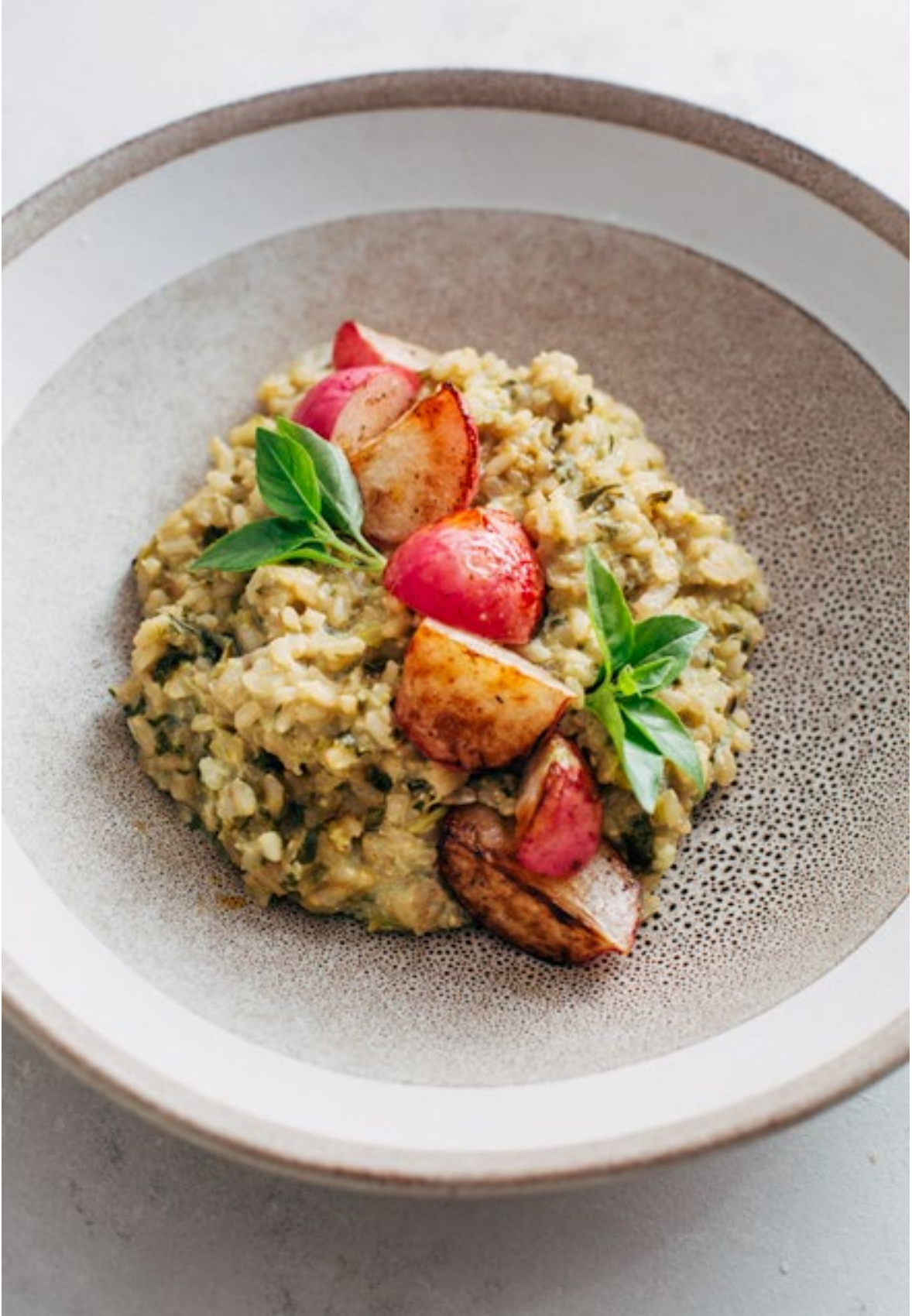
Risoto integral com pesto de ramas e rabanetes caramelizados. Receita de Carol Perdigão