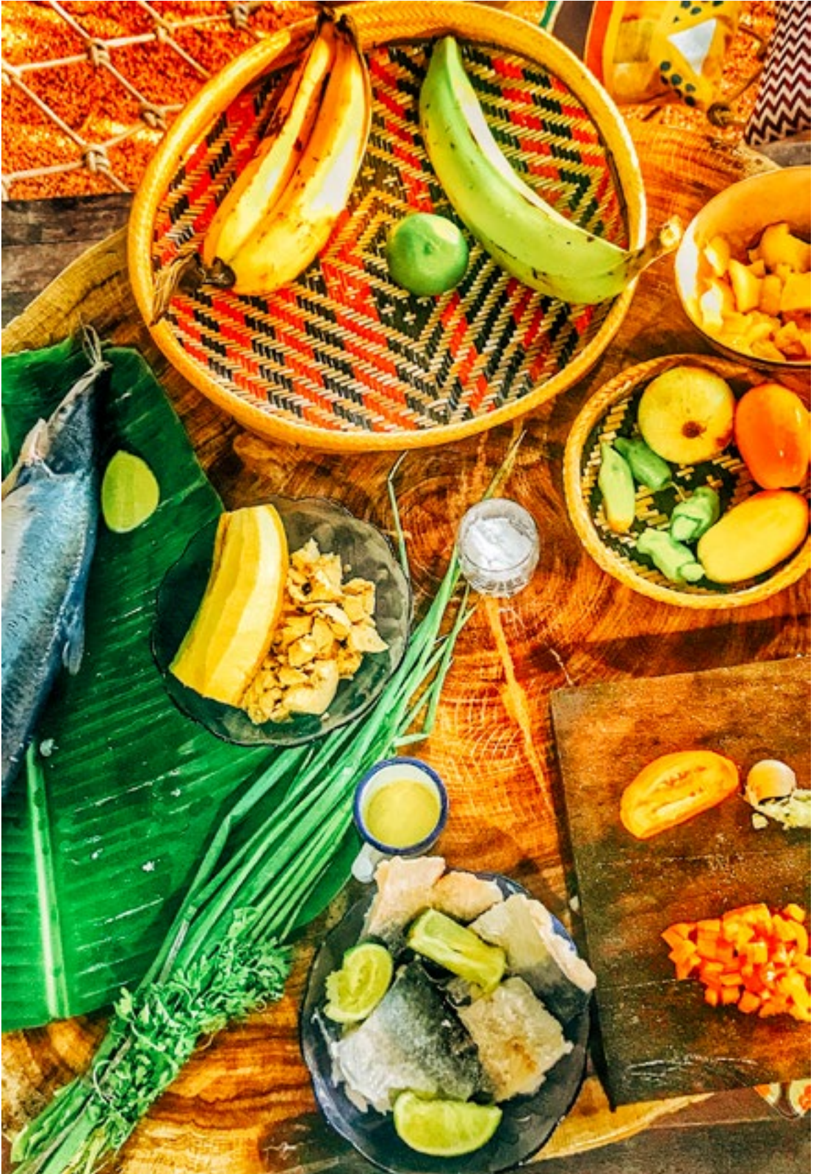
Tchorüne y Ba'ü. Receita de We'e'ena Tikuna