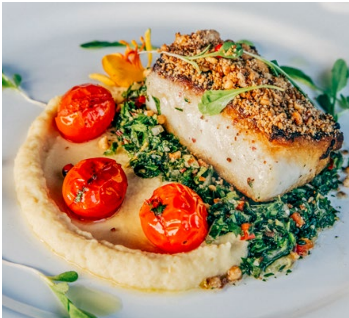
Tainha mediterrânea: Filé de tainha grelhada com crosta de castanha de caju, purê de grão de bico e salsa cítrica. Receita de Charly Damian.