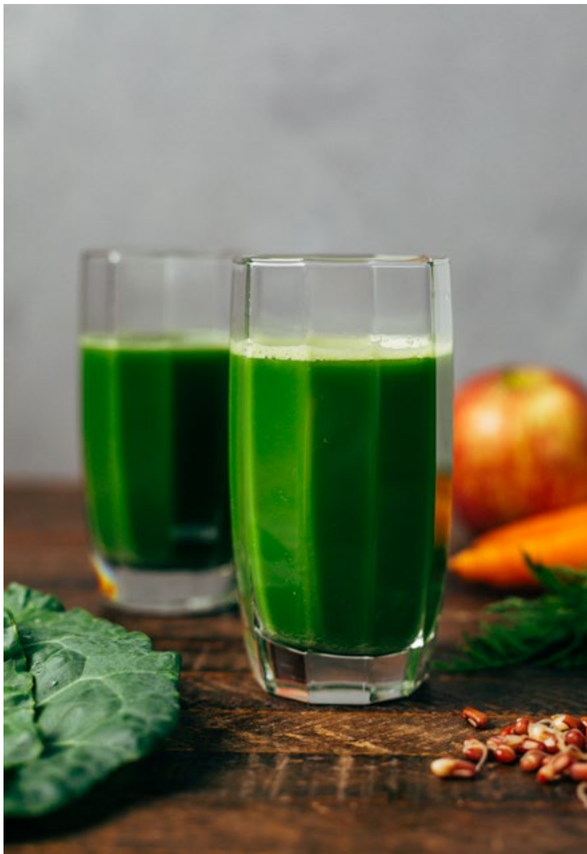
Suco de Clorofila. Receita do Projeto Terrapia - FioCruz / Rj