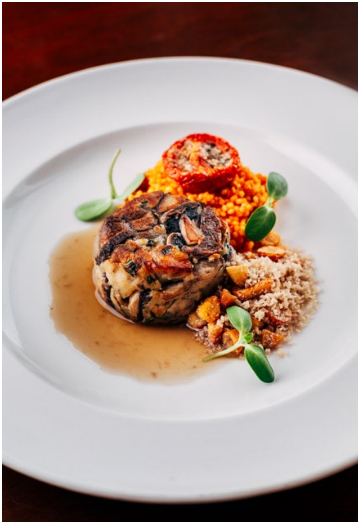
Medalhão de cogumelos e seu consomê com farofa de pinhão e risoto de mini arroz do vale do paraíba com tomate semi desidratado do vale do formoso. Receita de Ronaldo Canha.