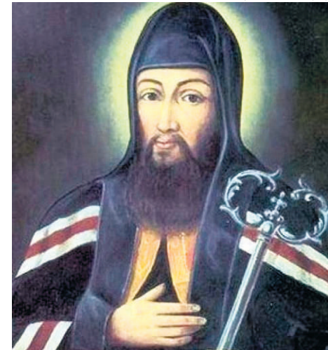
Josafá Kuncewyc (1580-1623). Monge polonês lituano. É chamado de padroeiro do ecumenismo

■ Livino. Missionário.