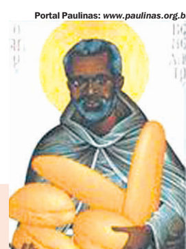
BENEDITO. O Negro (Sicília, Itália, 1526-1589)