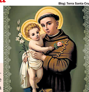
Blog: Terra Santa Cruz

ANTONIO (1195-1231). Padroeiro de Pádua e de Lisboa; doutor da Igreja