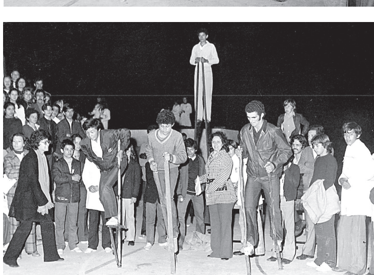
PARA SEMPRE. A gincana de 1974 na EE Paulo Sinna: a compenetração, a improvisação, a alegria de uma disputa sadia que o milagre da construção da memória preserva e traz aos nossos dias