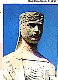
Blog: Rede Século 21 (RS21)

GISELA . Coroada e ungida a primeira rainha cristã dos húngaros entre os séculos X e XI