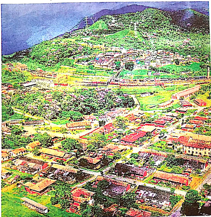
Celso Luiz/Banco de Dados - 25/2/2018

O entrevistado lembra também dos amigos que o ajudaram na reforma da igreja, sem qualquer despesa aos cofres públicos. Cita outras obras em andamento em Paranapiacaba e revela os cinco amores do seu pai, Américo Pinto Serra, avô do prefeito. Momento de emoção. Vale conferir os amores do saudoso Sr. Américo.