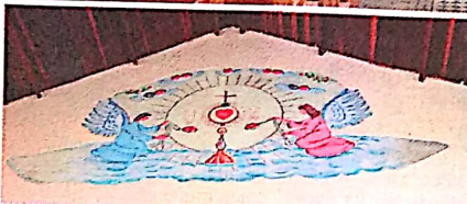
FEVEREIRO DE 2019. Vista interna da igreja Senhor Bom Jesus depois da nova pintura: no detalhe, os anjos no alto da cúpula principal