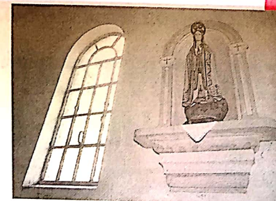
FEVEREIRO DE 1989. O inventário dos santos retratados pelo repórter-fotográfico João Colovatti. Fotos permaneciam inéditas no Banco de Dados. Mais uma colaboração do Diário à construção da memória do Grande ABC